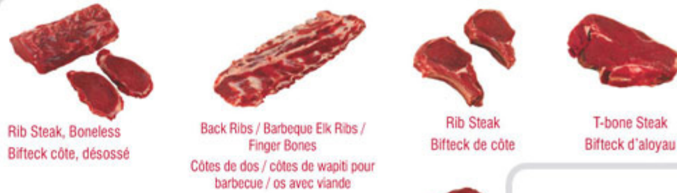
Rib Steak, Boneless / Bifteck côte, désossé Back Ribs / Barbeque Elk Ribs / Finger Bones / Côtes de dos / côtes de wapiti pour barbecue / os avec viande Rib Steak / Bifteck de côte T-bone Steak / Bifteck d'aloyau