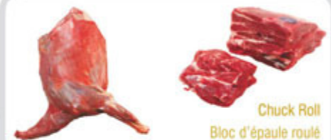
Chuck Roll / Bloc d'épaule roulé Front Quarter / Quartier avant