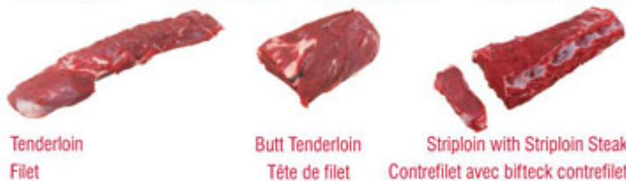
Tenderloin / Filet Butt Tenderloin / Tête de filet Striploin with Striploin Steak / Contrefilet avec bifteck contrefilet