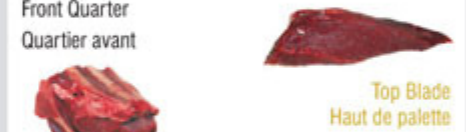
Top Blade / Haut de palette