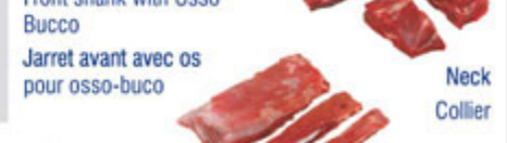
Front shank with Osso Bucco / Jarret avant avec os pour osso-bucco