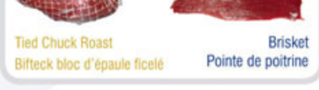
Tied Chuck Roast / Bifteck bloc d'épaule ficelé Brisket / Pointe de poitrine