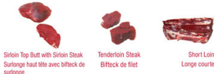
Sirloin Top Butt with Sirloin Steak / Surlonge haut tête avec bifteck de surlonge Tenderloin Steak / Bifteck de filet Short Loin / Longe courte