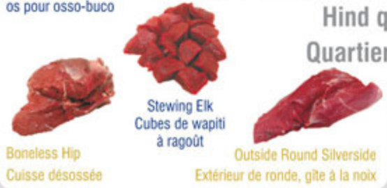
Boneless Hip / Cuisse désossée Stewing Elk / Cubes de wapiti à ragoût Outside Round Silverside / Extérieur de ronde, gîte à la noix