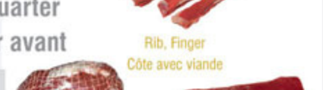
Neck / Collier Rib, Finger / Côte avec viande