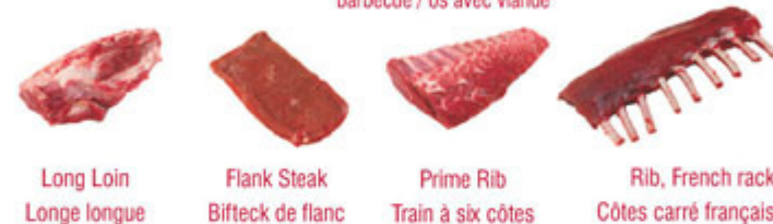
Long Loin / Longe longue Flank Steak / Bifteck de flanc Prime Rib / Train à six côtes Rib, French rack / Côtes carré français