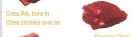
Cross Rib, bone in / Côtes croisées avec os